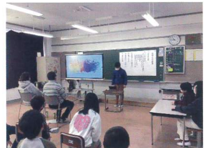
【4年生 リサイクル（環境）学習】

4年生は、環境学習でお世話になった地域の方、アルミ缶回収でお世話になった方をお招きし、1年間「環境」について学習してきたことをパワーポイントを使って発表しました。「マイクロプラスチックが環境に与える影響」についての発表では、ごみを分別して、プラスチックをリサイクルしていくなど、自分たちには何ができるかを伝えることができました。