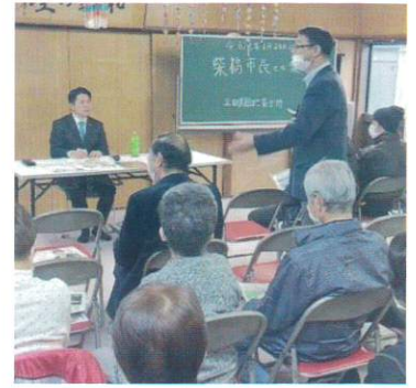
【住民と語り合う市長】