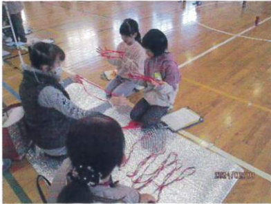
【1年生 昔から伝わる遊び】

令和6年2月3日(土)、岩野田小学校で「地域の方と学び」の協力による、「土曜日等の教育活動」が開催されました。