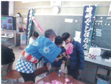
【3年生 岩野田の祭り】

3年生は、岩崎みこし保存会の方にお越しいただきました。岩野田の史跡、名所、伝統行事について、小学校の歴史、町の様子についてのお話を聞きました。中でも、みこし祭りについてのお話を詳しく聞き、みこしに飾る「花」の作り方を教えてもらいながら、花づくりにも挑戦しました。「岩野田の祭りに使うみこしのことが分かりました。花の作り方を丁寧に教えてくださったので、上手にできて、うれしかったです。」と笑顔で話をしてくれました。