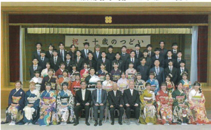
【新たに二十歳になられた皆さん】

1月7日(日)、岐阜市北部コミュニティーセンターにおいて「二十歳のつどい」を開催しました。1月にしては暖かい日差しがさす中、華やかな着物姿や新しいスーツ姿の二十歳になった56名の方にご参加いただきました。久しぶりに再会する学友との懐かしさもあり、皆さん笑顔があふれていました。