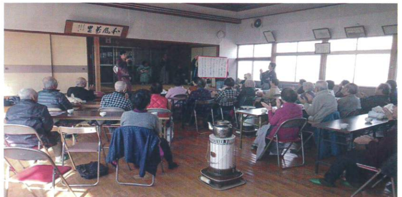
【演芸やカラオケを楽しむ皆さん 岩野田公民館】

ふれあい・いきいきサロンは同じ地域住民らが協働で企画し「誰でも」「歩いて」「気楽に」集合。歌ったり、笑ったり、語りあったり…(岐阜市社会福祉協議会の助成金を得て)同、岩野田支部では、現在、①岩崎サロン83名(3ブロックのミニサロンでも活動)、②サロンみた会20名、③山の手サロン25名が、毎月公民館などで定期的に顔を合わせ「楽しく」「気軽に」「無理なく」「独りぼっちじゃない…」をモットーに活動中です。地区の誰もが参加できる「元気の場づくり」を目指しています。