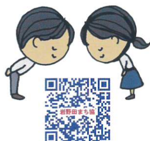
入賞作品は「岩野田まちづくり協議会」のホームページでご覧になれます