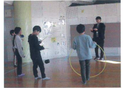
【2年生 岩野田児童センター訪問】

2年生は、岩野田児童センターを訪問しました。地域にある公共施設の使い方、ルールやマナーについて、実際に遊びながら学ぶことができました。公共施設にたくさんのルールがあるのは、「赤ちゃんや障がいのある人など、いろいろな方が使うからだ」ということが分かりました。