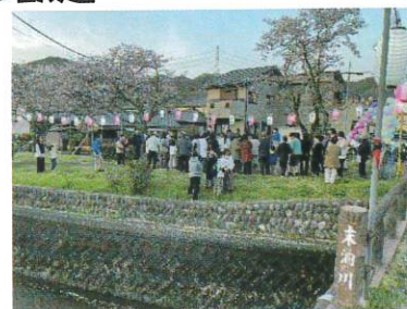
【昨年のさくら祭り】