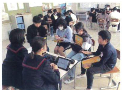
【6年生 先輩と語る会】

5年生は、水防団、消防士、防災士、中部地域づくり協会の方にお越しいただきました。今まで学んだDIGや校区の危険箇所や避難場所を確認した活動のまとめとして、テーマグループ毎に発表しました。今まで撮りためた写真を使ったり、災害が起こった様子を劇で表現したりして、自分たちのアイデアを生かして発表しました。また、地域の方からは、近所の人と仲良くなること、家族と避難場所を今日にでも話し合うこと、どのタイミングで避難するとよいかなど、普段から災害に備えておくことの大切さを教えていただきました。