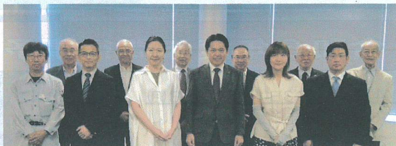
柴橋市長との面談を終えて

この大洞を愛し、危機感を共にする南・東両連合会長、顧問、元役員、県・市の議員、在住の市幹部、そして子どもたちのために汗を流す若者の有志で‘大洞十三人衆’を昨秋から立上げ、10年、20年先のふるさとの夢や課題を語り合い、アイデアを交換してきました。