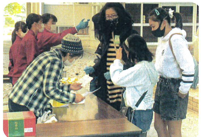
青少年育成会 夢作りフェスタ