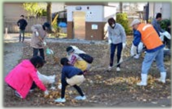
「クリーンシティぎふの日」はみんなで清掃活動