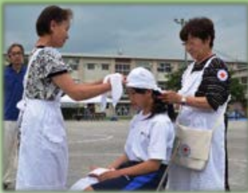
応急手当をする日赤奉仕団のみなさん