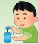
④手洗い・消毒する