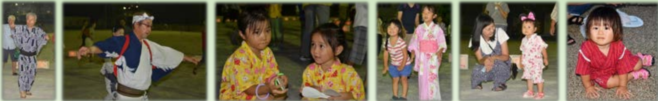
「夏祭り」ふれあい盆踊り大会には、お年寄りや子どもなど多くの方が参加し、大きな踊りの輪に！