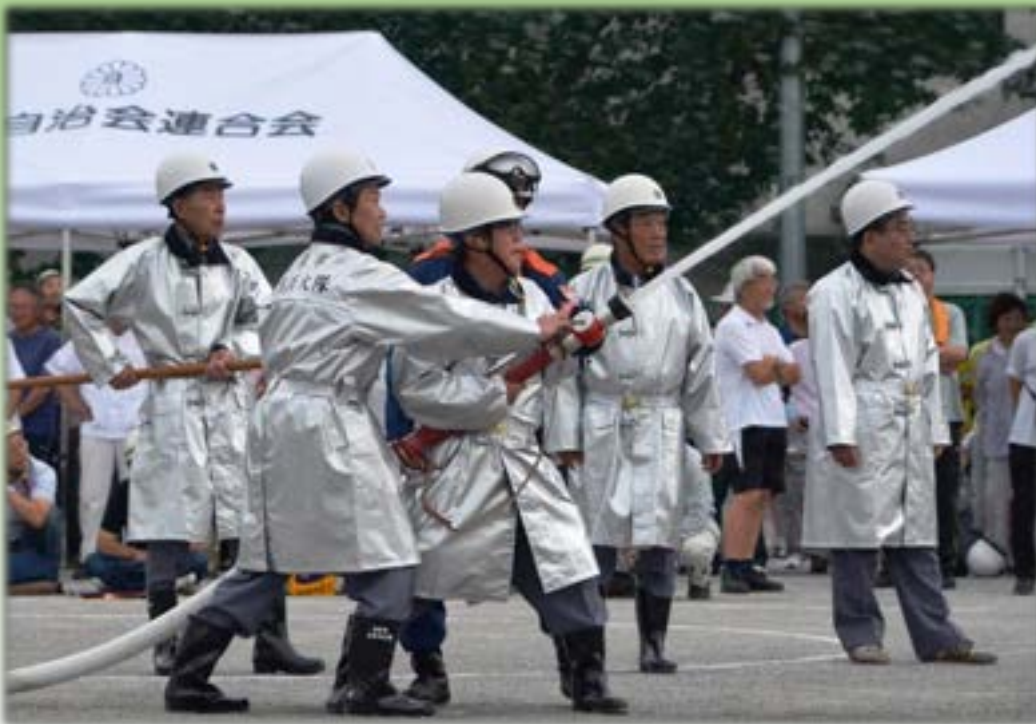
防災訓練をする市民消防隊のみなさん