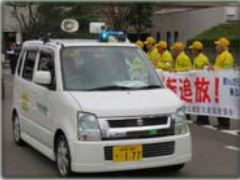
青色回転灯パトロール車による防犯・特別警戒活動