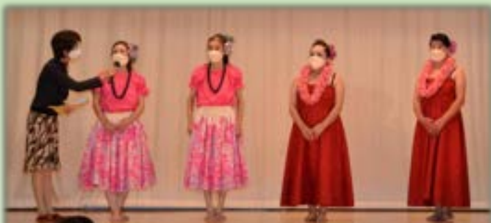
4地区公民館サークル発表会では、日頃の練習の成果を発表しました。