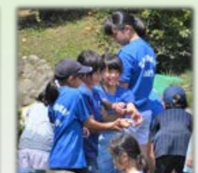
早田ふれあいデーでは、各種団体のみなさんが趣向を凝らしたイベントを企画し、子どもたちとふれあいながら、楽しい時間を共有しました。