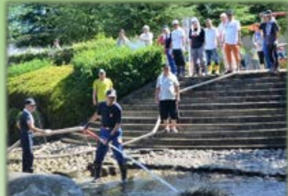
早田川コミュニティ水路の清掃では消防団が大活躍