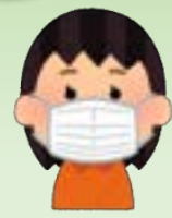
③マスクを着用する