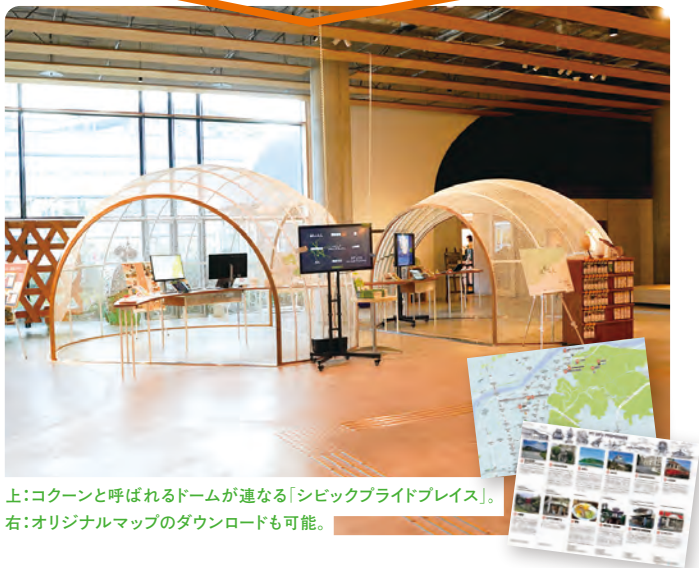
上:コクーンと呼ばれるドームが連なる「シビックプライドプレイス」。 右:オリジナルマップのダウンロードも可能。