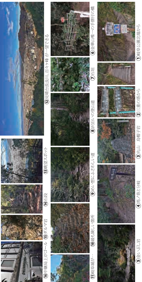
① 岐阜公園北端から ② 三重の塔から ③ 丸山、鳥帽子岩 ④ 馬ノ背と分岐 ⑤ 金いぶし岩 ⑥ 金華山唯一の手摺りの橋 ⑦ 石段 ⑧ 眺望スポット ⑨ 眺望スポット ⑩ 眺望スポット ⑪ 眺望スポット ⑫ 眺望スポット ⑬ 眺望スポット ⑭ 眺望スポット ⑮ 眺望スポット ⑯ 眺望スポット ⑰ 眺望スポット

うさぎとした樹林とゆるやかな道が続き、小さな沢があたりして物思ひにふひながら歩くにまぎら打つこづの小徑です。植物は、ツツジ・ヒツジバ・シタ・ヌギ・ヒノキの太木が林立しています。早朝は野鳥のささづりが段々と大きく賑やかです。中腹にはビュポイントが幾つかあり長良川と岐阜市内を一望できます。終盤は厳しい箇所がありますので注意が必要です。