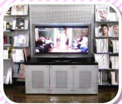
ブランドコレクション放映