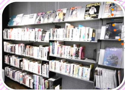
専門誌/ビジネス支援コーナー

アパレル関係者をはじめ、 さまざまな人たちが幅広く 利用できる、全国で唯一の 公立によるファッション 専門図書館です。