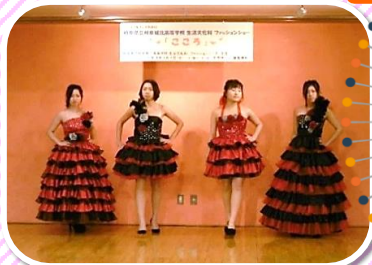
岐阜県立岐阜城北高等学校の生徒によるファッションショーの様子