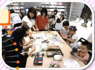
岐阜女子大学の講師・学生によるワークショップの様子

2002年の開館当初より、 岐阜市立女子短期大学をはじめ 市内の大学、専門学校、高校等 と連携し、ファッションをテーマ にした展示やワークショップ、 ファッションショーを開催して います。