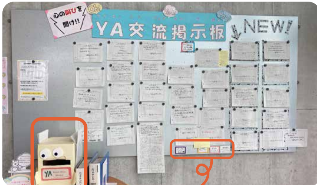
ポストはこれ↑ 担当はカラーで分かれています。返事にも個性が！

誰が返事を書いてくれるかはお楽しみ！実は司書たちも匿名なんです。恋愛に勉強に受験…10代ならではの相談がたくさんあって眩しいよね～本に関する質問なども歓迎ですよ。