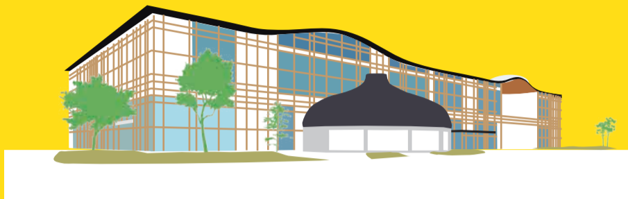
みんなの森 ぎふメディアコスモス