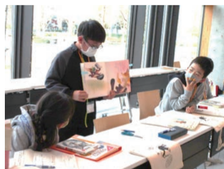
↑発表も積極的です！

「絵本の読み聞かせ」や「POPづくり」、情報や資料探しをお手伝いする「レファレンス」などの仕事を、ワークショップを通して学んでいきます。みんな難しい課題にも楽しみながらも真剣な顔で取り組みました。