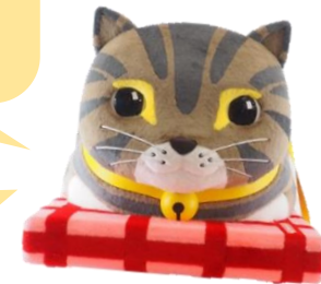
▲ にゃんこカート「にゃん吉」