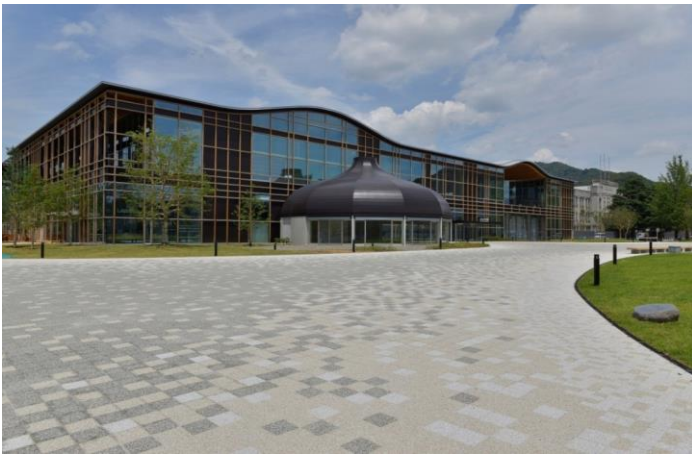
みんなの森ぎふメディアコスモス 外観