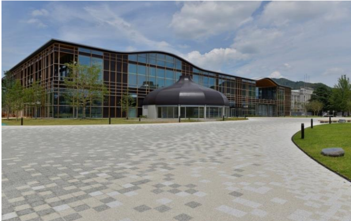
みんなの森ぎふメディアコスモス 外観

(受験票の部分については、受験申込書上段の記入心得4を必ず参照の上、提出してください。)